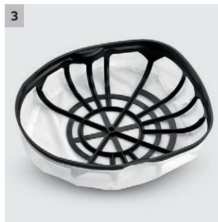
3 Filtre panier