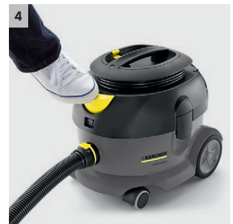
4 Large bouton marche/arrêt au pied