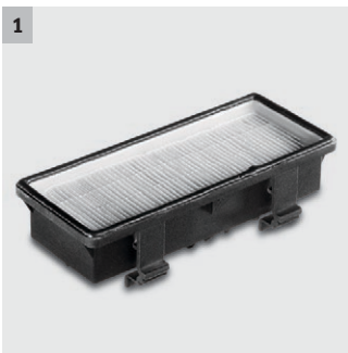
1 Filtre HEPA

L'aspirateur professionnel poussières T 12/1 est silencieux et très performant. Il est idéal pour le nettoyage en milieu professionnel où le silence est de rigueur.